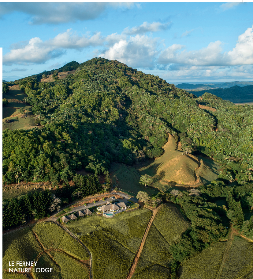
LE FERNEY NATURE LODGE.

La nuit pour 2 personnes à partir de 305 euros, petit déjeuner compris.